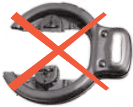
Rahmen- oder Speichenschlösser