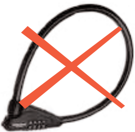
Kabel- und Spiralkabelschlösser